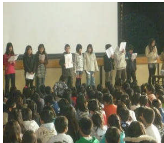
(給食委員会からの発表)

給食 感謝週間 一二月七日に給食感謝集会を行いました。毎日給食を食べる喜びと毎日作ってくれている調理員さんたちに感謝する集会でした。給食委員会の児童から給食の歴史や食べ物のクイズを行いました。七日、十一日の一週間は給食感謝週間としました。