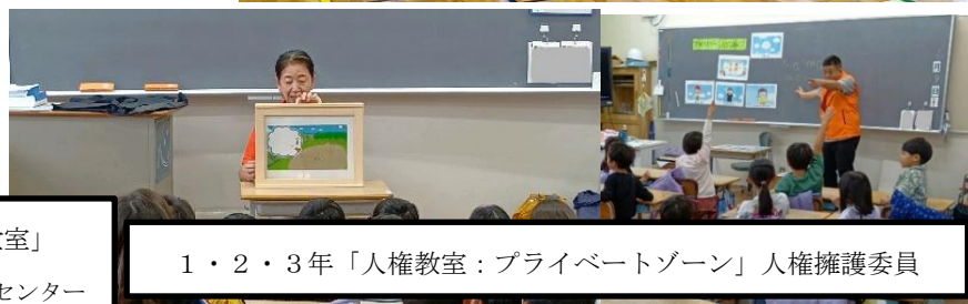
1・2・3年「人権教室：プライベートゾーン」人権擁護委員