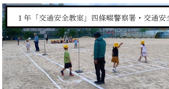
1年「交通安全教室」四條畷警察署・交通安全協会