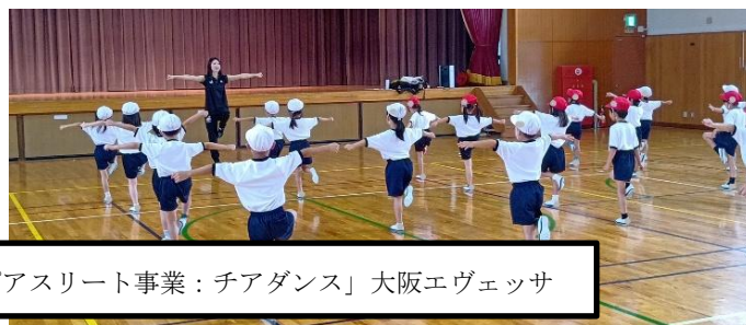
1年「トップアスリート事業：チアダンス」大阪エヴェッサ