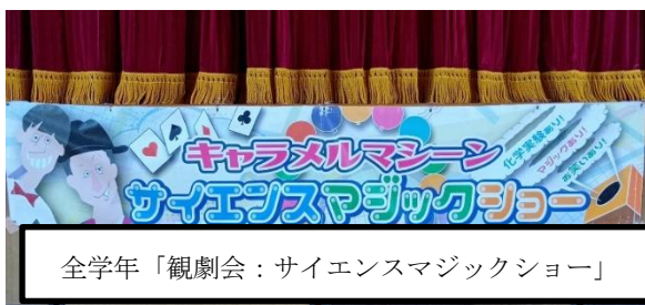
全学年「観劇会：サイエンスマジックショー」

地域の方、企業の方、専門家の方、多くの大人が「子どもたちにとって」よりよい教育環境となればと様々な思いや情熱を抱いておられます。「子どもを中心に据えた」教育活動を今後も展開していきます。