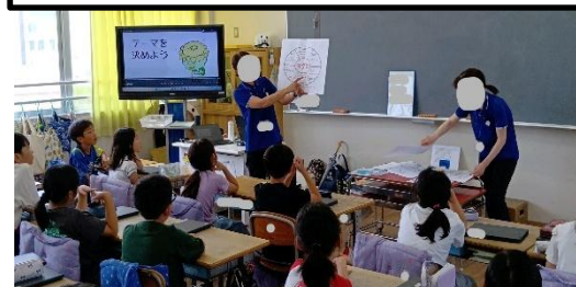
4年「調べる学習コンクール出前授業」中央図書館