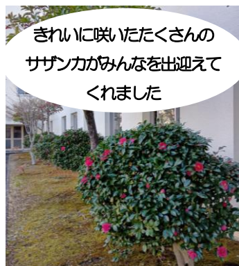
きれいに咲いたたくさんの サザンカがみんなを出迎えて くれました

始業式と終業式では、子どもたちに“節目”の話をしました。ものごとの終わりや始まりにきちんと区切りをつけると節のある竹のように強く頑丈になれます。毎日の授業でもやっているように、はじめに『めあて』を確認し、終わりにやったことを『ふり返る』ことで、より良い次のステップに進み、それを繰り返すことで成長するのだと思います。