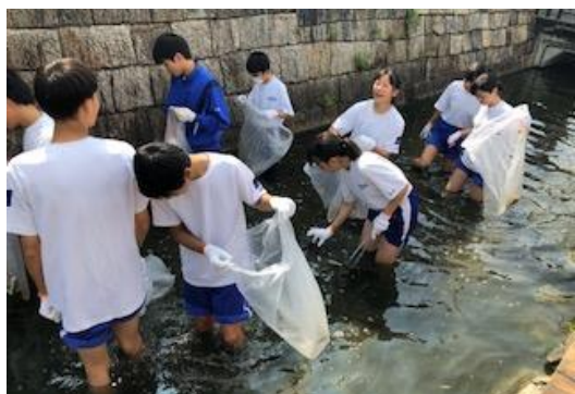
【御領せせらぎ水路のボランティア清掃】

笑顔と元気な声が学校に戻ってきました。夏休みの間に大きな事件や事故に巻き込まれたり、命にかかわるような大きな怪我をする生徒もなく、無事に2学期を迎えられたことに安心するとともに、あたたかく見守ってくださったご家庭や地域の皆さまに感謝の思いでいっぱいです。