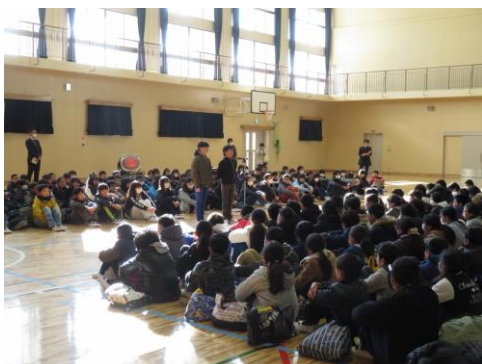
＝体育館：6年生あいさつ＝