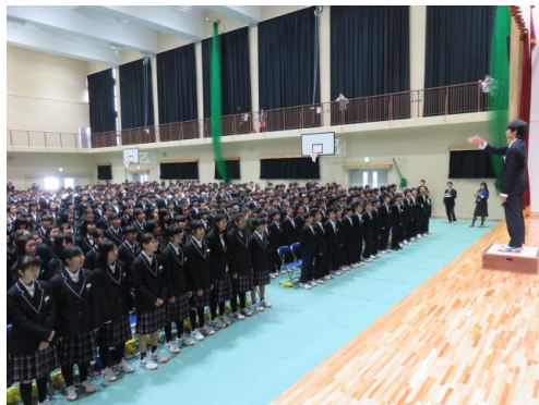
＝全校生徒による校歌斉唱＝

10月27日(金)、南郷中の誰もが完成を待ち望んだ新体育館を使用し、「百花繚乱 ～南中生よ、大きな花束となれ～」のテーマのもと、第48回文化祭を行いました。