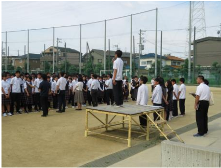
= 7月18日全校集会 =

1年生は、4月6日(木)の市民会館キラリエホールでの入学式から71日間、2・3年生は全学年が揃った4月10日(月)のグラウンドでの始業式から70日間の1学期でした。