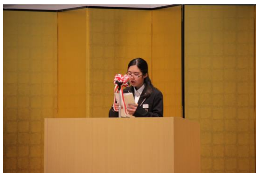
＝新入生代表・誓いの言葉＝